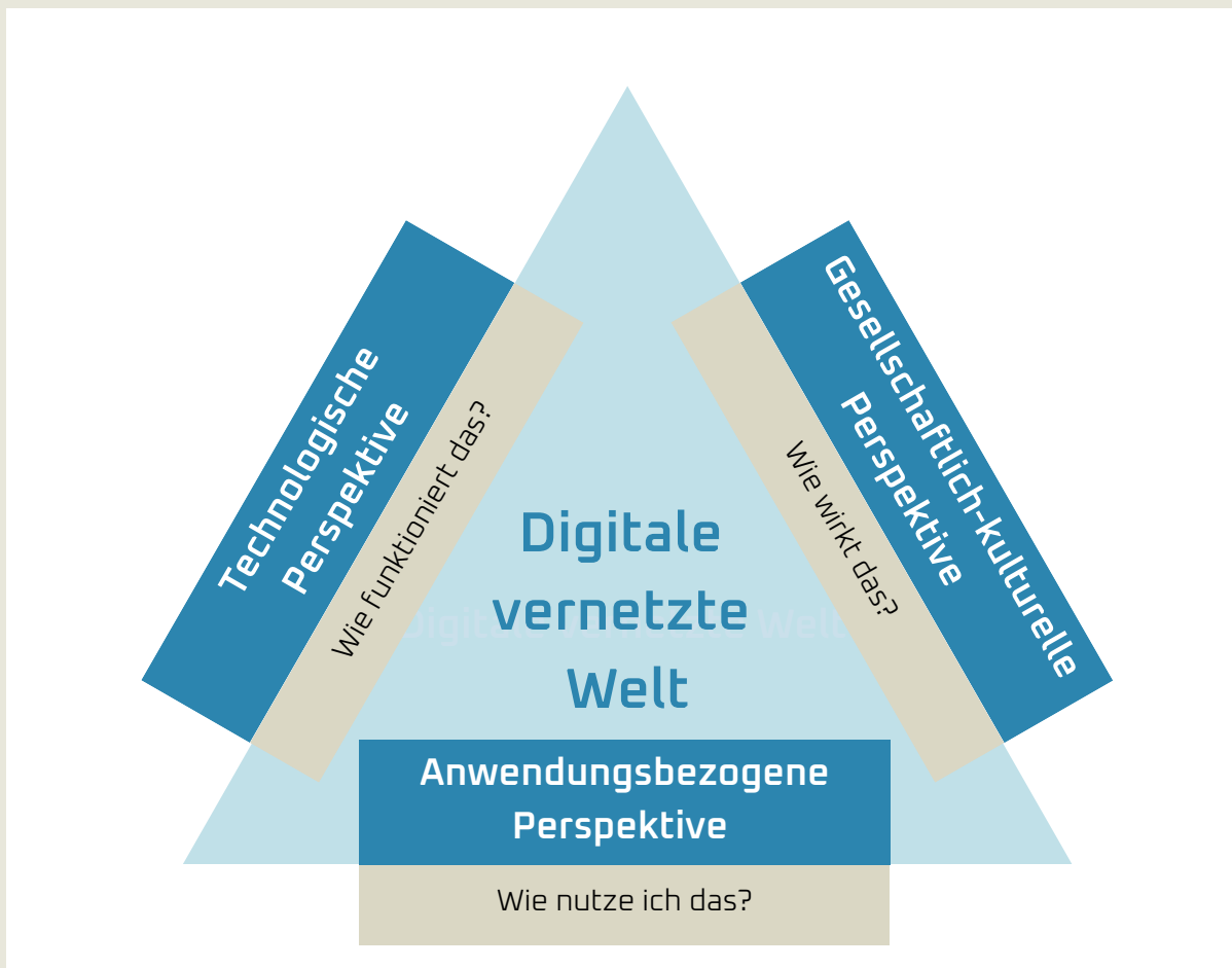
Abbildung 3: Dimensionen zum Zurechtfinden in der digitalen Welt nach Prochaska 2022

Für eine erfolgreiche Digitalisierung benötigen alle betroffenen Personen grundlegende digitale Kompetenzen. Dabei lassen sich mit der technologischen, der gesellschaftlich kulturellen und der anwendungsbezogenen Perspektive drei Dimensionen identifizieren, die für das Zurechtfinden in einer digitalen und vernetzten Welt notwendig sind (Prochaska, 2022). Das zeigt noch einmal deutlich, dass Digitalisierung eben keine rein technische Angelegenheit ist, sondern immer auch eine menschliche Komponente aufweist.