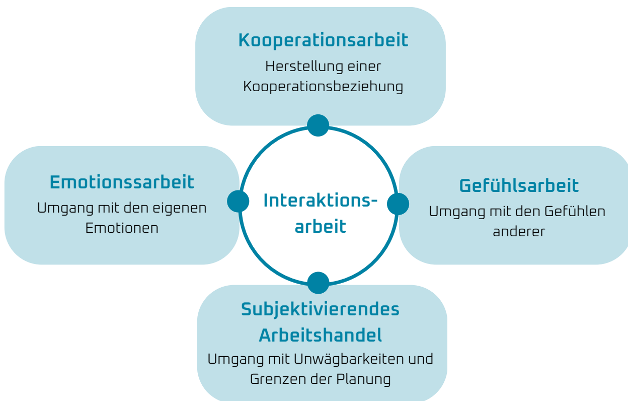
Abbildung 2: Dimensionen der Interaktionsarbeit nach Böhle et al. 2015

Die vorangegangenen Ausführungen zeigen, dass Braeseke et al. 2020 nicht nur technische Hemmnisse für die Umsetzung der Digitalisierung in der Pflege identifiziert haben. Auch der Mensch spielt dabei eine wichtige Rolle, wie die Beispiele Akzeptanzprobleme und mangelnde Kompetenzen der Mitarbeitenden zeigen. Das mag für die meisten Branchen zutreffen, ist aber gerade in der Pflege als menschenzentrierte Tätigkeit von besonderer Bedeutung. Denn neben Wissens- und Planungsarbeit ist Pflege vor allem Interaktionsarbeit. Gemeint ist damit die direkte Arbeit am und mit den Menschen, die in der Pflege unerlässlich ist. Wie Abbildung 2 zeigt, differenzieren Böhle et al. 2015 nochmals zwischen Emotions-, Gefühls- und Kooperationsarbeit sowie subjektivierendes Arbeitshandeln und identifizieren so vier Dimensionen der Interaktionsarbeit, die auf jeweils unterschiedliche Aspekte bezogen sind.